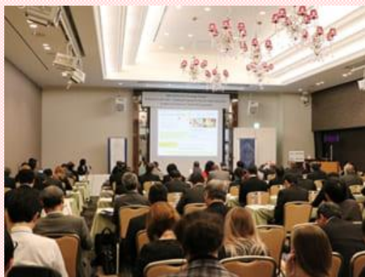
“シンポジウムの様子”

このたび、金沢大学が申請した「日露をつなぐ未来共創リーダー育成プログラム」が、文部科学省「『大学の世界展開力強化事業』～ロシア、インド等との大学間交流形成支援～」に採択されました。本プログラムは、学士課程から大学院までの多層的な交流プログラムで、文化交流だけではなく、基礎科学、先端科学技術、先制医療などの専門分野に対応した交流プログラムも実施し、将来的には学生のみならず国民間の交流へと繋げていきます。その先駆けとして、2～3月にはロシアのイルクーツク、カザン・サンクトペテルブルグにおいて2つの文化交流プログラムを実施します。