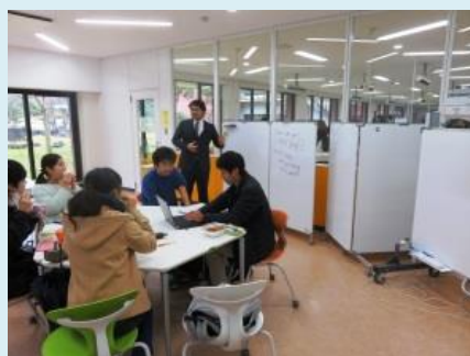
“ランチタイム英会話での様子”

金沢大学では、学生の皆さんの英語能力向上に向けた各種取組を行っています。TOEICのスコアを伸ばしたい！英会話を練習したい！そんな学生一人一人のニーズに対応すべく、英語学習アドバイザーによる「英語力UPプログラム」が、10月から始動しています。