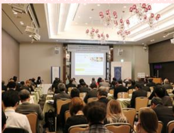
“Picture from the symposium”

KU’s application for the “Training Program for Russia-Japan Innovative Leaders of Tomorrow” was successfully selected for the Japanese Ministry of Education, Culture, Sports, Science and Technology’s “Re-Inventing Japan Project FY2017: Support for the Formation of Collaborative Programs with Russian and Indian Universities.”